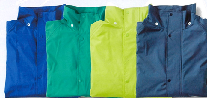
ブルー Blue ターコイズ Turquoise ペパーミント Peppermint ネービー Navy

素材 表地/ポリエステル100%タフタ (塩化ビニール引き) 裏地/ポリエステル 100% メッシュ